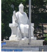
Tsar Samoil, 2011