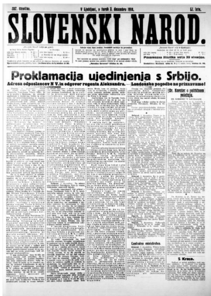
Slika 2: Objava nastanka Kraljevine SHS; vir: https://zgodovinanadlani.si/1918-nastanek-kraljevine-shs/ .

Ko je postalo jasno, da Avstro-Ogrska izgublja vojno, je cesar Karel I. izdal manifest, v katerem je obljubil preoblikovanje monarhije. Korošec je na to reagiral z znamenitimi besedami: "Vaše veličanstvo, prepozno je! Usoda je že določila!"