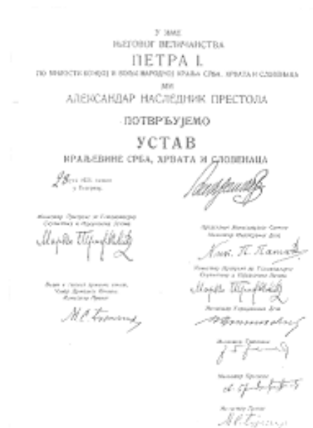
Slika 3: Sprejetje Vidovdanske ustave; vir: http://zgodovina.si/vidovdanska-ustava/ .

Korošec in Slovenska ljudska stranka sta bila kritična do ustave, saj je ta omejevala avtonomijo Slovencev in drugih narodov.